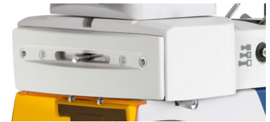
OBN 141/OBN 147