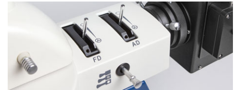
Unidad de iluminación