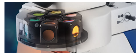
Rueda de filtro sextuple OBN 148