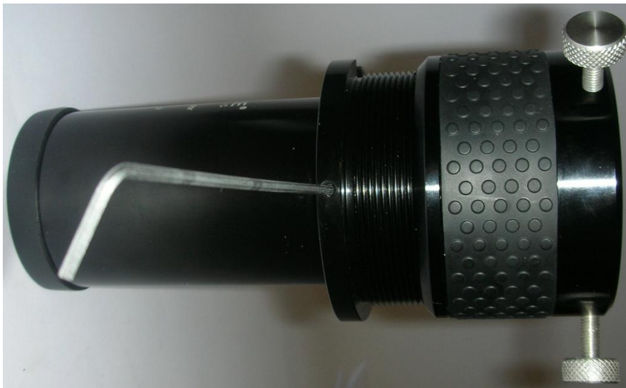
Abbildung 2: Hinteransicht mit 2mm Innensechskant