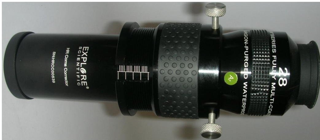
Abbildung 4: HR Coma Corrector mit Okular 3mm unter Anschlag

Jetzt setzen Sie ein Okular in den Komakorrektor ein, und klemmen es mit den Klemmschrauben. Dann stellen Sie das Objekt scharf, indem Sie einfach das verstellbare Fokussiererteil mit dem Okular drehen. Wenn Sie wissen, wo in Ihrem Okular der Fokus sitzt, können Sie den entsprechenden Wert direkt auf der Scala einstellen. Wenn zum Beispiel bekannt ist, daß ein Okular den Fokus im Okular 3mm unterhalb des Steckhülsenanschlags hat, dreht man den Fokussierer so weit, daß die Scala den Wert 13,5+3=16,5\text{mm} anzeigt: