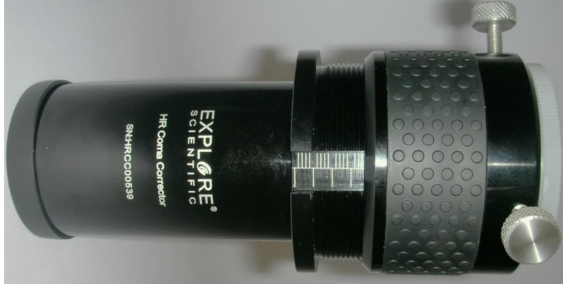
Abbildung 3 Nullstellung

Zuerst bringen wir den Helical-Fokussierer des HR Coma Corrector auf den richtigen Abstand. An der Seite des HR Coma Corrector sehen Sie eine Nut mit einer lasergravierten Scala. Sie haben jeweils vier Striche nach links (im Abstand von jeweils 1mm), sowie alle 5mm einen Strich nach rechts zur besseren Übersicht. Sie schrauben jetzt den Helical-Fokussierer des HR Coma Correctors so weit auf, daß die Kante des beweglichen Teils des Helical-Fokussierers 13,5mm über dem Anschlag sitzt, wie in der Abbildung unten gezeigt.