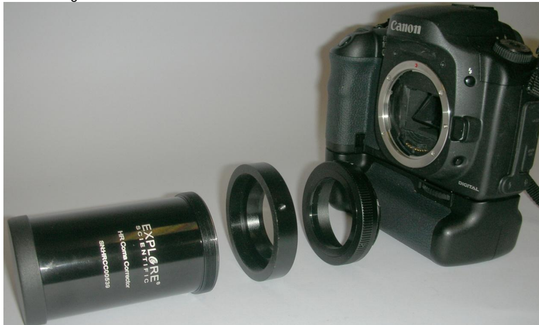
Abbildung 5: HR Coma Corrector mit T2-Adapter, T2-Ring und Kamera

Für die Verwendung mit einer Kamera muß der Helical-Okularauszug des HR Coma Correctors entfernt werden. Schrauben Sie dazu den kleinen Innensechskant-Gewindestift auf der Rückseite des Helical-Okularauszuges (von der Skala aus gesehen) so weit heraus, daß sich der Helical abschrauben läßt, wie in Abbildung 2 ersichtlich. Sie haben zwei Adapter, um Ihre Kamera an den HR Coma Corrector anzuschließen: einen Adapter auf T2, den Sie für die Verwendung z.B. mit digitalen Spiegelreflexkameras (DSLR) benötigen. Bitte beachten Sie, daß Sie bei der Verwendung des Korrektors mit einem speziellen Kameratyp noch zusätzlich des T2-Adapter für diesen Kameratyp benötigen. Der entsprechende T2-Adapter ist nicht im Lieferumfang des HR Coma-Correctors enthalten.