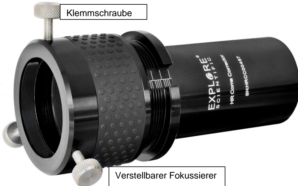
Abbildung 1: Vorderseite

Herzlichen Glückwunsch zum Erwerb Ihres Explore Scientific HR Coma Correctors. Sie können den HR Coma Corrector sowohl visuell als auch photographisch einsetzen. Im Auslieferungszustand ist der HR Coma Corrector für den visuellen Betrieb vormontiert. Die Einheit besteht aus dem Grundkörper des HR Coma Correctors und dem aufgeschraubten Helical-Fokussierer. Der Helical-Fokussierer ist durch einen kleinen seitlichen Innensechskant-Gewindestift gegen versehentliches Aufschrauben gesichert. Dieser Gewindestift kann mit einem handelsüblichen 2mm Innensechskantschlüssel entfernt werden (nicht im Lieferumfang enthalten).